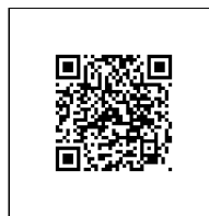
Zažádejte o vytyčení